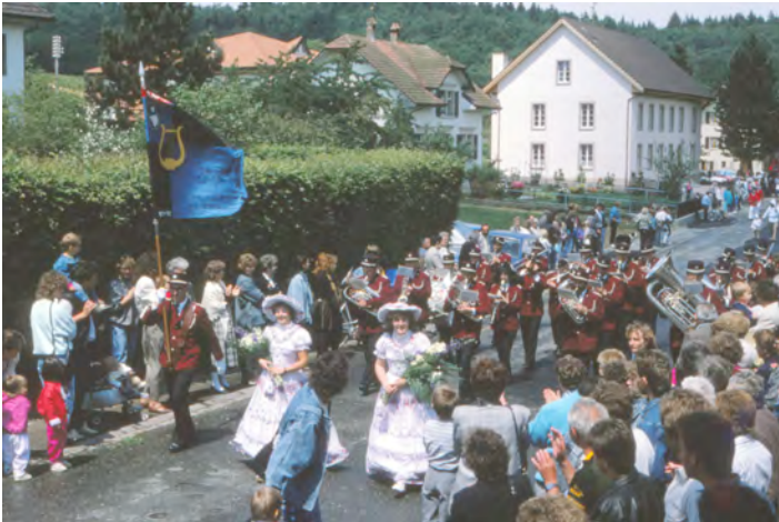
Umzug beim 125-jährigen Geburtstag der Feldschützen

Die Pfingstausflüge gehen in die 80er Jahre zurück. Mit „Kind und Kegel“ wird ausgerückt, das Gewehr darf natürlich nicht fehlen. Nach dem Schiessen wird gegrillt, gegessen und mit Schützenlatein geprahlt. Eine gemütliche Sache, die Kameradschaft wird gepflegt.