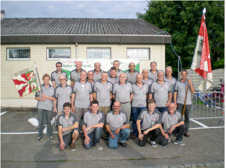
Mitglieder im Jubiläumsjahr