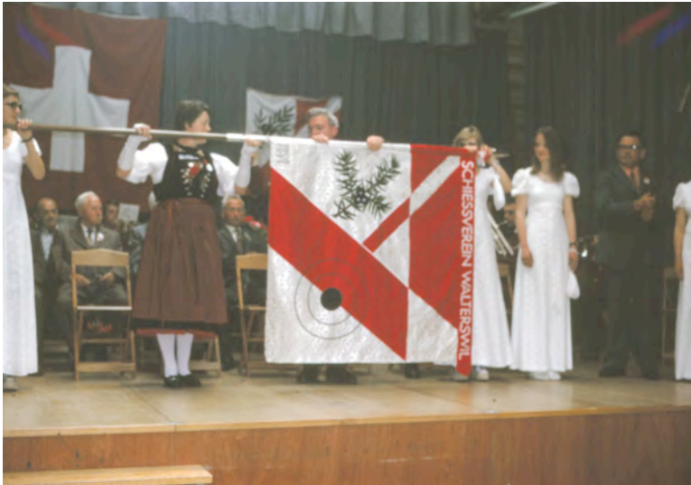
Fahnenweihe Schiessverein Walterswil 1976