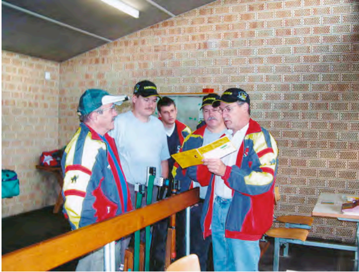
Fachdiskussion und Resultatanalyse